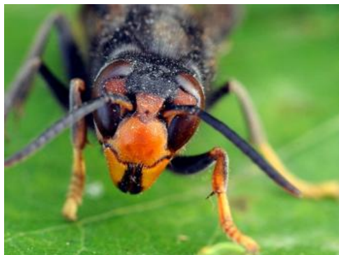
Lutte contre le frelon asiatique

Le frelon asiatique, dont la reproduction est rapide, a envahi le département. C'est un prédateur des abeilles. Pour préserver l'écosystème, aider les apiculteurs et l'ensemble des citoyens à lutter contre la prolifération du frelon asiatique, vous pouvez fabriquer des pièges. La campagne de piégeage a commencé mi-février mais peut se poursuivre jusqu'à mai + septembre à Novembre . Attention, passée cette période, vous risquez de capturer de nombreuses espèces autochtones (frelons jaunes, guêpes... etc.), il vaudra donc mieux retirer les pièges.