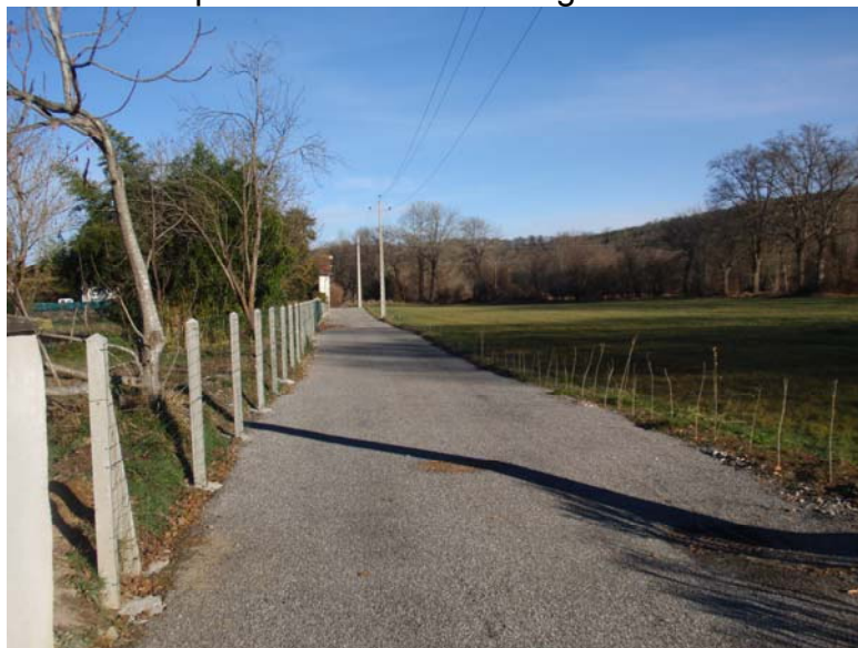
après les travaux