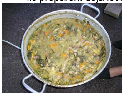
La garbure de Barzun