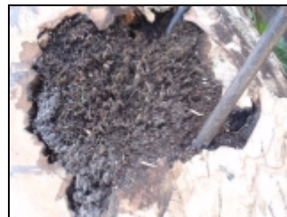
l'intérieur des troncs pourris