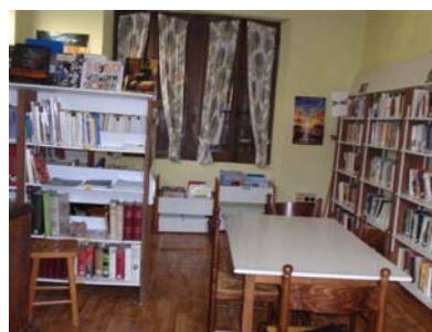
Bibliothèque de BARZUN

c) Déchetteries : les habitants de Barzun comme ceux des 15 communes de la CCOG sont autorisés à utiliser les services des 2 déchetteries d'Espoey et de Pontacq. Une carte obligatoire de couleur bleue est délivrée par votre mairie.