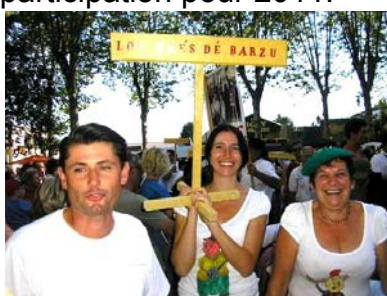
« Lous très de Barzu »