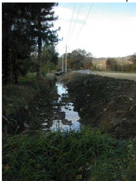
avant les travaux de busage,