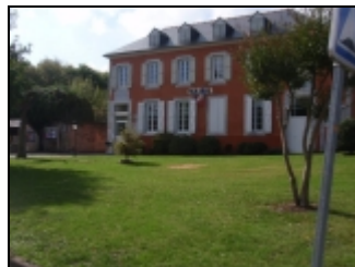
..et après abattage,