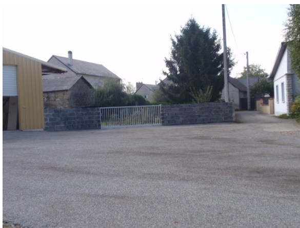
La nouvelle «Place Gérard Laborde»